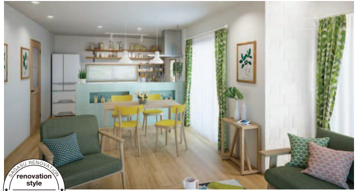
SAGASU RENOVATION style * renovation style * NATURAL STYLE

ラステックな質感をいかしたちょっとした遊びがあるインテリア。カリフォルニアの生活スタイルをコンセプトに表現。