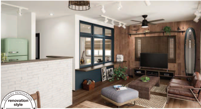
SAGASU RENOVATION style * renovation style * VINTAGE STYLE

LIXIL リフォームショップがお届けする「さがすリノベーション」は、憧れの住まいのカタチを変え、そして、ヒトの気持ちを変える家づくりをお手伝いします。